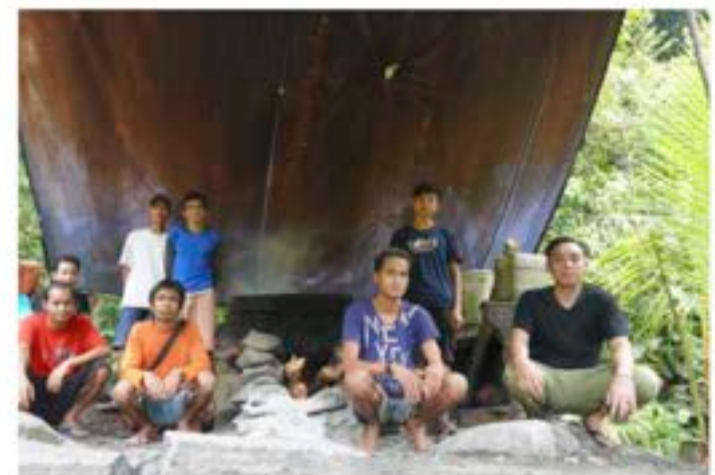
Kelompok petani yang memproduksi gula aren.