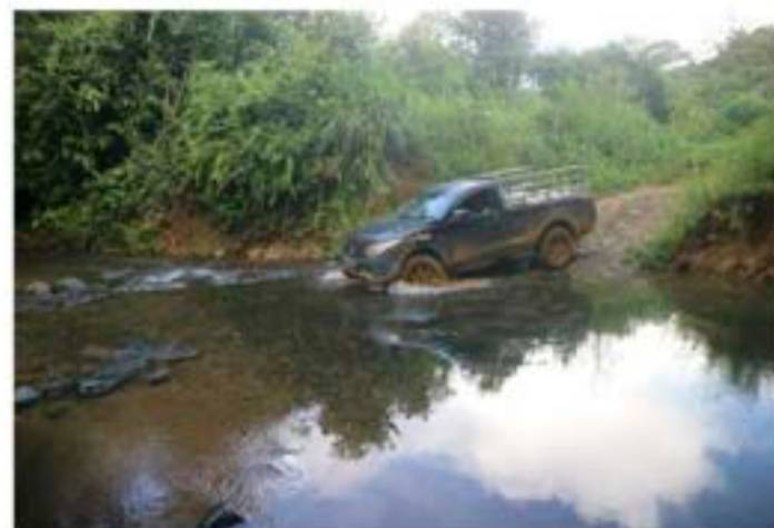
roses pengambilan gula aren di Desa Langan yang melewati sungai