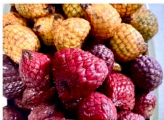
warna-warni buah asam maram.