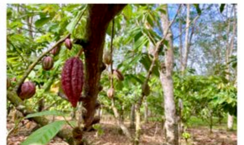
Juli 2023 Pohon kakao berbuah subur diantara perkebunan karet