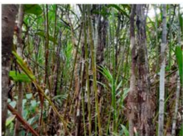
pohon asam maram yang tumbuh subur di area lahan gambut.

Dengan hilirisasi produk buah Maram yang memiliki nilai ekonomi lebih tinggi, kita dapat menjadikan buah Maram yang sebelumnya tidak memiliki nilai menjadi bernilai sekaligus membantu mencegah alih fungsi lahan menjadi perkebunan monokultur guna memenuhi kebutuhan pokok masyarakat setempat.