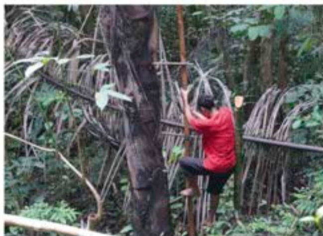
proses pemanenan air nira aren dengan cara memanjat pohon aren yang tingginya bisa mencapai 25 meter.

Petani gula aren dari Desa Langan, Kabupaten Melawi, merupakan kelompok masyarakat adat yang menggantungkan penghasilan utamanya dari gula aren. Desa Langan merupakan desa terpencil yang tidak ada sumber listrik, tidak ada sinyal, dan infrastruktur jalan yang buruk. Untuk mencapai Desa Langan, kita harus menggunakan mobil besar karena pada titik tertentu mobil harus menyeberang dan membelah sungai untuk mencapai Desa Langan karena kurangnya akses jalan. Pohon aren yang tumbuh di Desa Langan merupakan pohon aren yang tumbuh liar di daerah perbukitan. Pohon aren yang tumbuh subur di kawasan hutan hujan tropis telah memberikan dampak ekonomi sebagai sumber pendapatan utama masyarakat di Desa Langan. Kehadiran Kalara Borneo menjadi salah satu solusi mengatasi logistik yang panjang dan infrastruktur yang kurang memadai. Dengan menempatkan posisi akses pasar lebih dekat dengan petani, maka dapat mengurangi beban biaya logistik akibat minimnya akses jalan. dan memaksimalkan pendapatan petani dengan gula aren sebagai pendapatan utama.