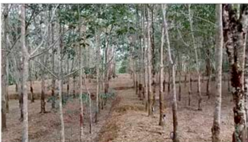
2018 dan tahun sebelumnya Perkebunan karet monokultur

Pada awalnya, mayoritas petani lokal bergantung pada perkebunan monokultur untuk mata pencaharian mereka. Namun sejak tahun 2018, petani mulai menanam kakao di antara kebun karet guna memaksimalkan pendapatan ekonomi tanpa memperluas area perkebunan dengan menebang pohon. Kalara Borneo bekerja sama dengan petani kakao dari Desa Benua Baru, Kabupaten Sintang, yang menerapkan sistem tanam kakao dengan tumpang sari diantara pohon-pohon karet. Misi Kalara Borneo adalah menciptakan pasar yang lebih dekat dengan petani dan hutannya sehingga pada saat pasca panen, pohon kakao yang telah ditanam petani memiliki akses pasar yang lebih dekat dengan harga premium dan dibeli langsung dari Kalara Borneo.