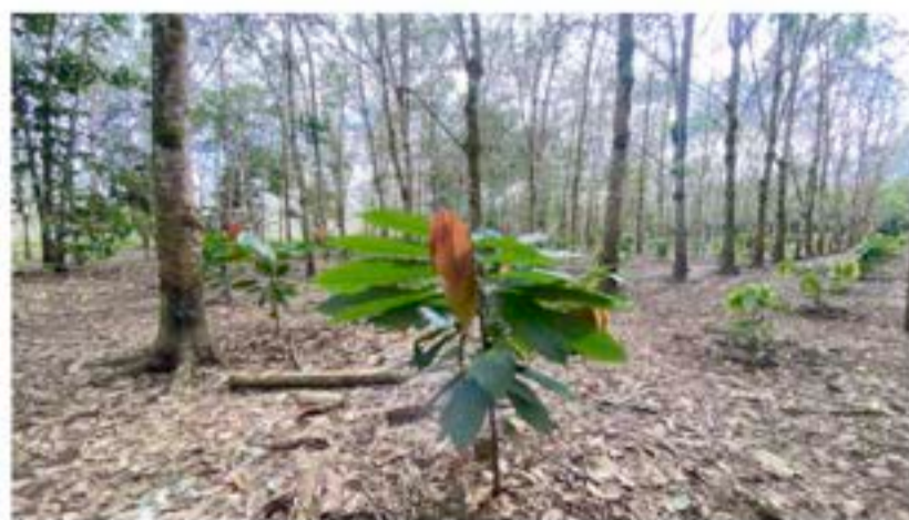
Februari 2021 pohon kakao usia 11 bulan yang tumbuh baik diantara perkebunan karet